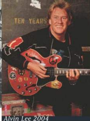
Alvin Lee 2004

Aufwärmgeräuschen von Drums, Orgel und Gitarre Alvin Lee „Hello!“ ins Mikrofon rief, ging es los. Ein stehender Akkord, eine Rock-Stimme, ein Drum-Beat, eine Band ... und schon war ich mitten drin in diesem Album, von dem ich das Wichtigste überhaupt lernte, was man über Kunst lernen kann: Die Welt ist bunt! Und es gibt nicht nur den einen Weg, Sound, die eine Farbe, Form oder Funktion, wenn du etwas ausdrücken willst. Also bedien dich!