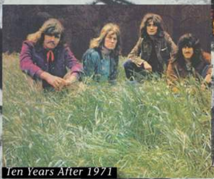
Ten Years After 1971