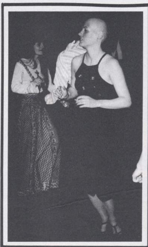
La sala está muy bien, los punkys ahora están en todas partes, las niñas de cabeza rapada, shorts plásticos y tee-shirts punks abundan. Los punks hacen sus danzas y los saltos cangurescos abundan.