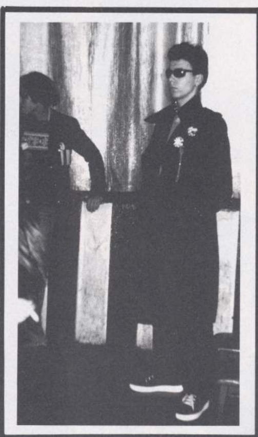
CHICO es un personaje extraño, un filósofo, un loco o un sabio, no sé definirlo, lo cierto es que el tío se ha dado la vuelta a medio mundo, y lo mismo te habla árabe que japonés.